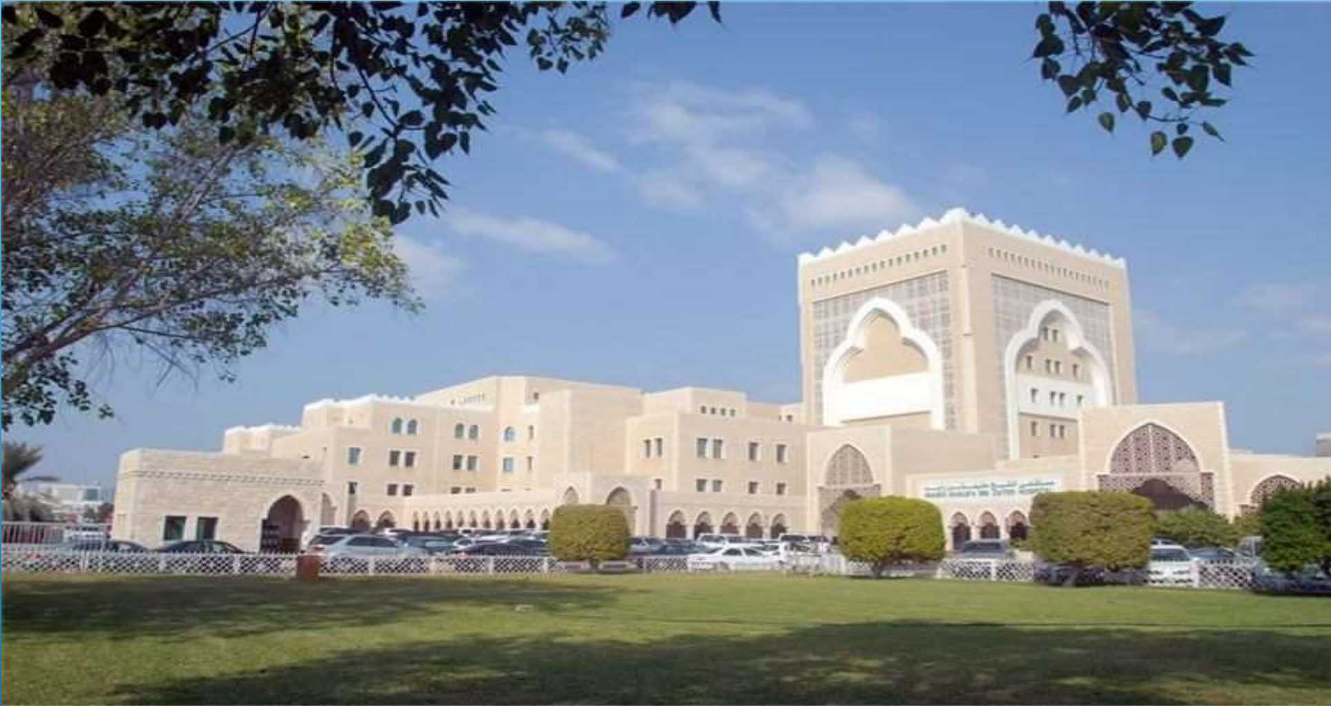
SHEIKH KHALIFA MEDICAL CITY – ABU DHABI